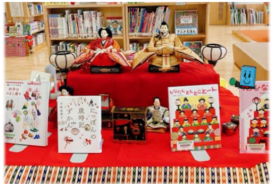
▲昨年の関連本展示の様子(旭図書館内)